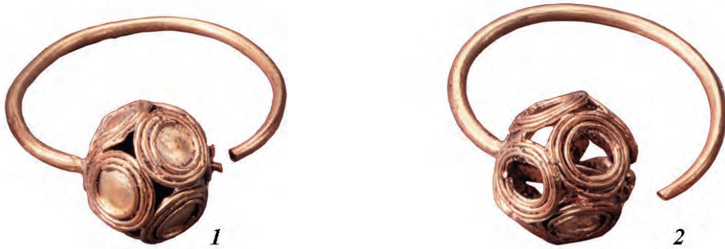
Рис. 3. Курганный могильник Львовский Первый-2. Курган 12. 1–2 – золотые височные привески. Фото без масштаба (Календарь «Эхо тысячелетий», 2007)