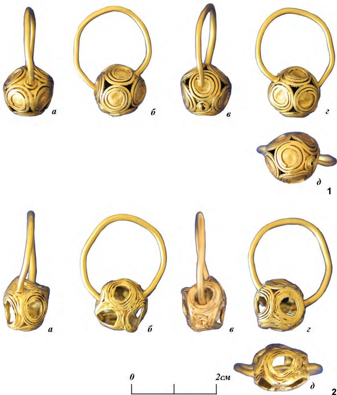
Рис. 1. Курганный могильник Паласа-сырт. Курган 91. 1–2 – золотые височные привески. Фото 2021 г. Fig. 1. Palasa-Syrt burial mound. Mound 91. 1–2 – gold temple pendants. Photo of 2021.

количество пластин – 2 экз.; тонкая проволока (d–0,5 мм).