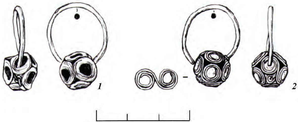
Рис. 2. Курганный могильник Паласа-сырт. Курган 91. 1–2 – золотые височные привески. Художник З.З. Кузеева.