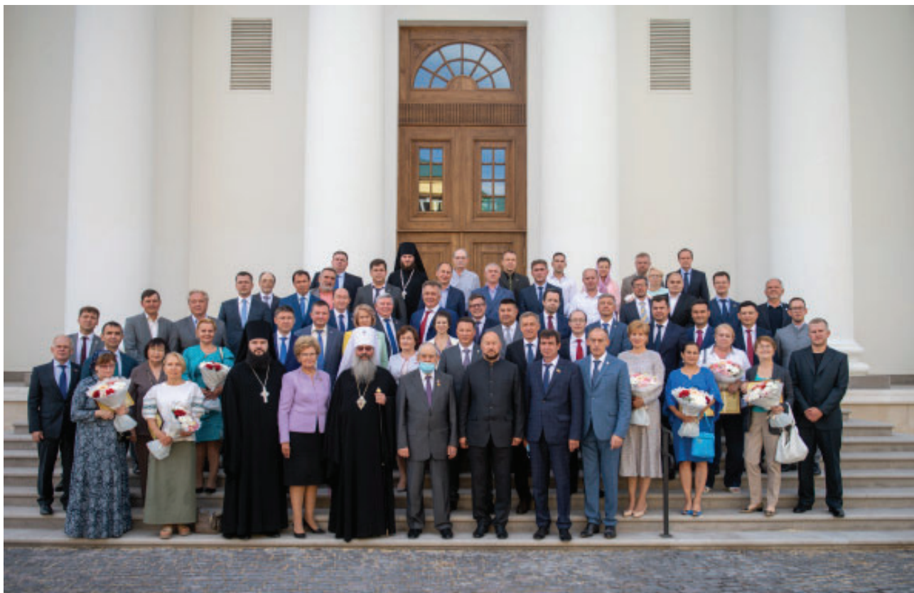
Рис. 3. Участники торжественной встречи в честь воссоздания Собора Казанской иконы Божией Матери.