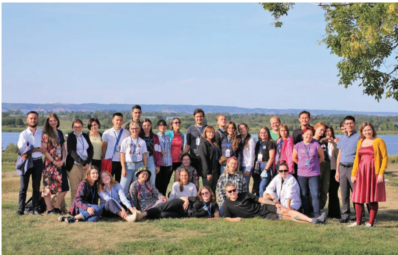
Рис. 9. Участники VIII Международной археологической школы в Болгаре Fig. 9. Participants of the 8th International Archaeological School in Bolgar

ресурсов для внедрения новейших достижений мировой науки в практику изучения и сохранения историко-культурного наследия народов Евразии. Школа ориентирована на потребности молодых учёных в знакомстве с новыми методами, представлении актуальных данных и коллаборации. Мероприятие традиционно проходило на базе Болгарского историко-архитектурного музея-заповедника. В этом году занятия VIII Международной археологической школы проходили в рамках трёх научно-практических направлений: «Археометрия», «Палеоантропология» и «Методы комплексных археологических исследований в изучении взаимодействия человека и окружающей среды». Участниками стали 34 человека: студенты и молодые учёные из 15 городов и населенных пунктов России, Беларуси, Казахстана и Молдовы. По итогам работы археологической школы участникам были предоставлены сертификаты и возможность публикации в очередном номере рецензируемого журнала «Археология евразийских степей» (рис. 9).