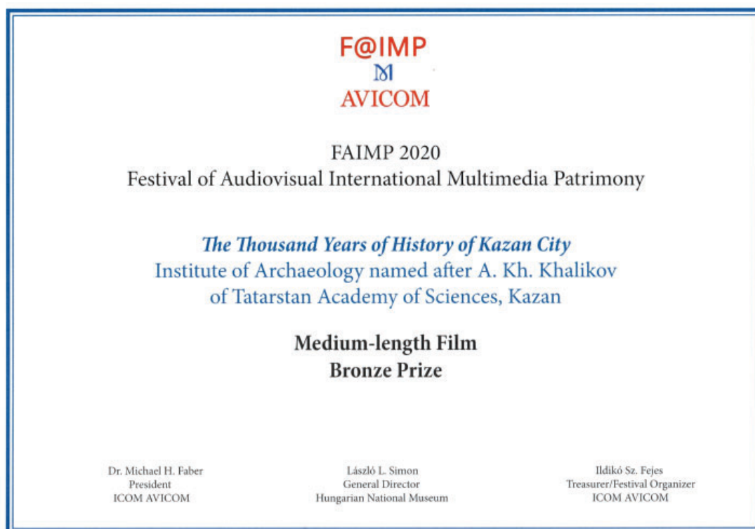
Рис.6. Награда Института археологии им. А.Х. Халикова АН РТ за документальный фильм «Тысячелетняя история города Казани».