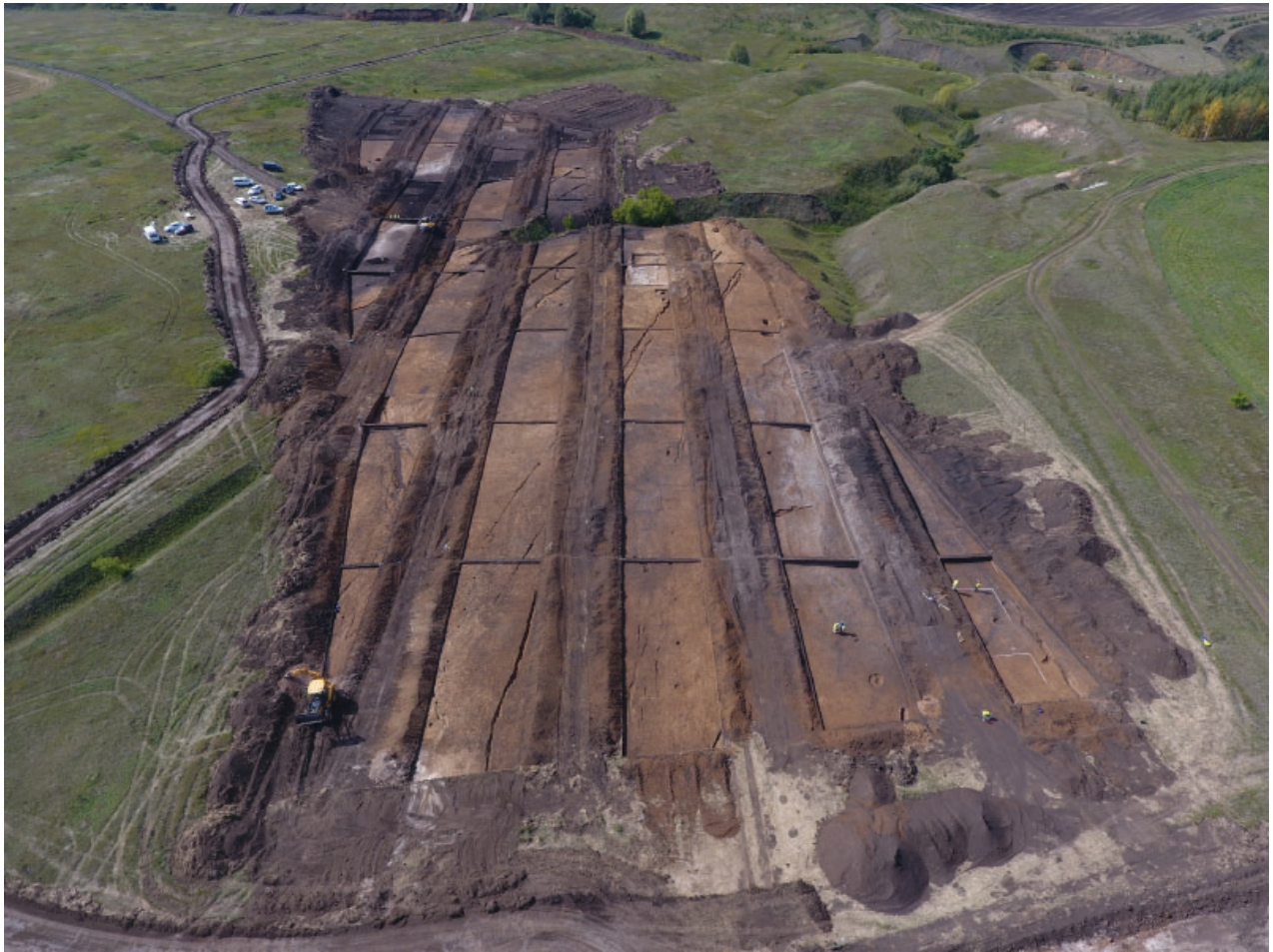
Рис. 8. Исследования объекта культурного (археологического) наследия «Поселение Средняя Куланга» в Кайбицком районе Республики Татарстан в 2021 г.