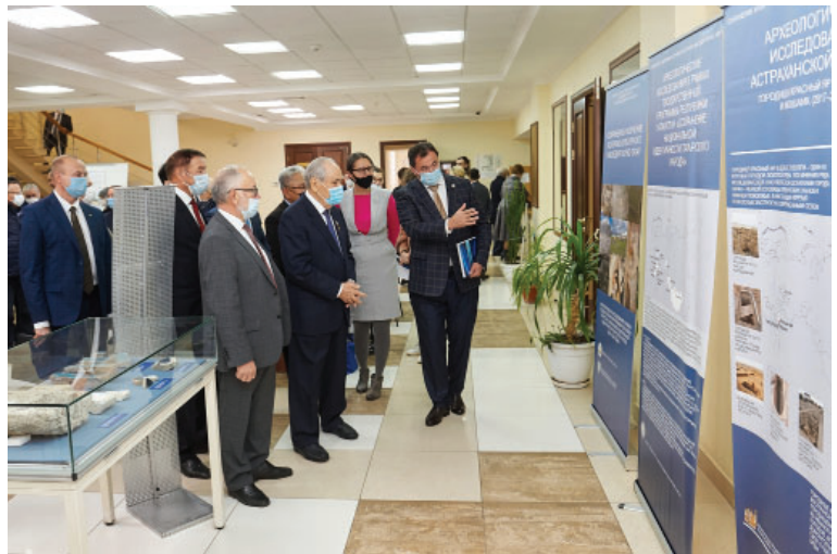
Рис. 4. Государственный Советник Республики Татарстан Шаймиев М.Ш. на выставке, посвященной к 30-летию Академии наук Республики Татарстан Fig. 4. State Counselor of the Republic of Tatarstan Mintimer Sharipovich Shaimiev at an exhibition dedicated to the 30 th anniversary of the Academy of Sciences of the Republic of Tatarstan

туда в рамках Государственной программы Республики Татарстан «Сохранение национальной идентичности татарского народа (2014–2020 годы)», направленной на проведение историко-археологических исследований средневековых городов и изучение историко-культурного тюрко-татарского наследия за пределами Республики Татарстан (рис. 4).