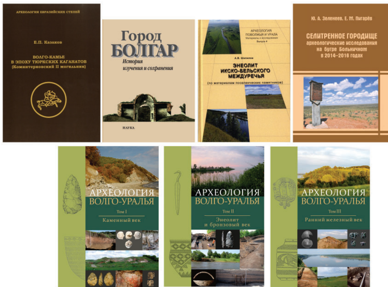
Рис. 1. Обложки монографий, опубликованных сотрудниками Института археологии имени А.Х. Халикова АН РТ в 2021 г.