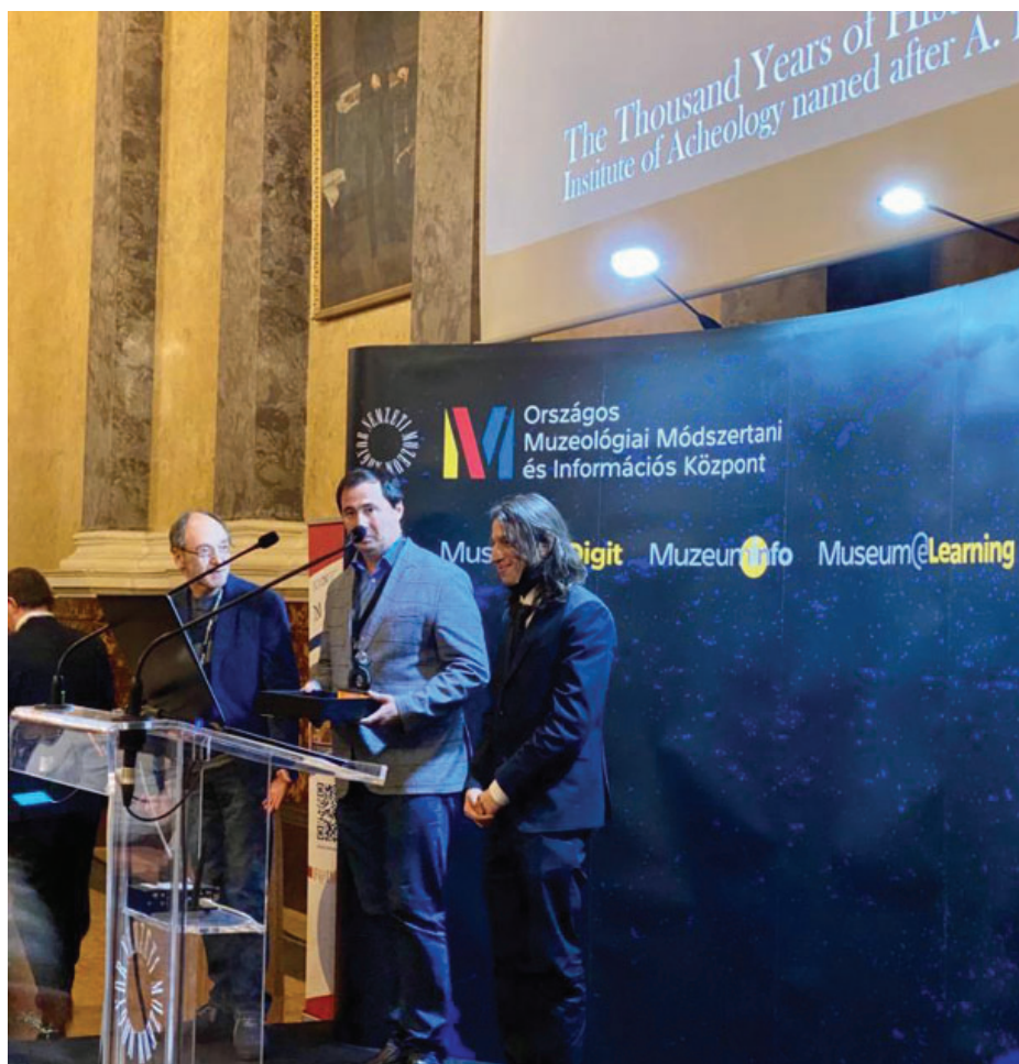
Рис. 5. Награждение победителей Международного медиа-фестиваля F@IMP 2020. Венгерский Национальный музей, г. Будапешт.