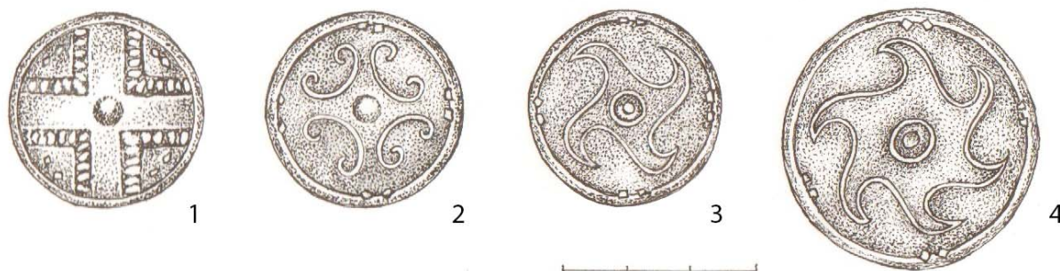
Рис. 3. 1–4: Могильник Ново-Ябалаклинский 1, курган 2, погребение 3. Челюстно-лицевая подвеска. Бляшки: 1 – крест; 2 – крест с завитками; 3, 4 – крест в форме вихревой свастики. Автор рисунка Волкова Н. В.