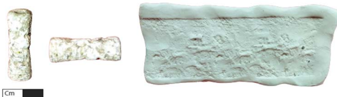
Рис. 2. Цилиндрическая печать из Адналы и ее оттиск. Fig. 2. Cylinder seal from the Adnaly and its imprint.