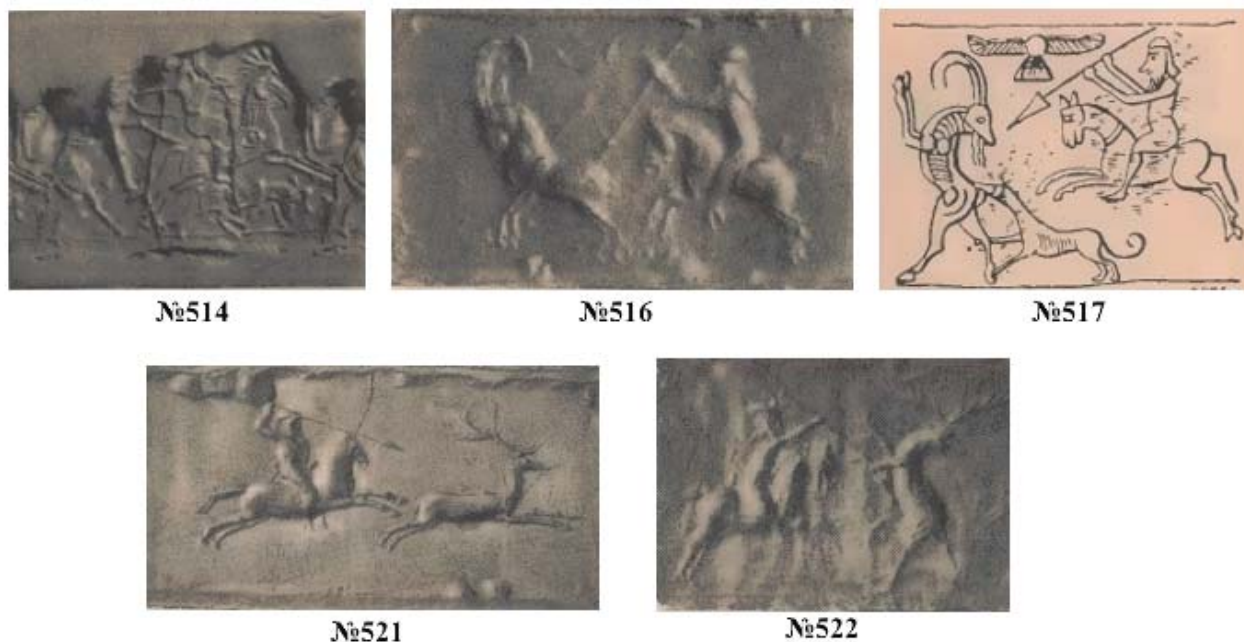
Рис. 4. Оттиски цилиндрических печатей из Ашшура (по: Weber, 1920). Fig. 4. Imprints of seals from the Assur (after Weber, 1920).

территории Ближнего Востока. К сожалению, ничего не известно о других материалах из разрушенного погребения, чтобы можно было сказать еще что-то по поводу происхождения данного артефакта.