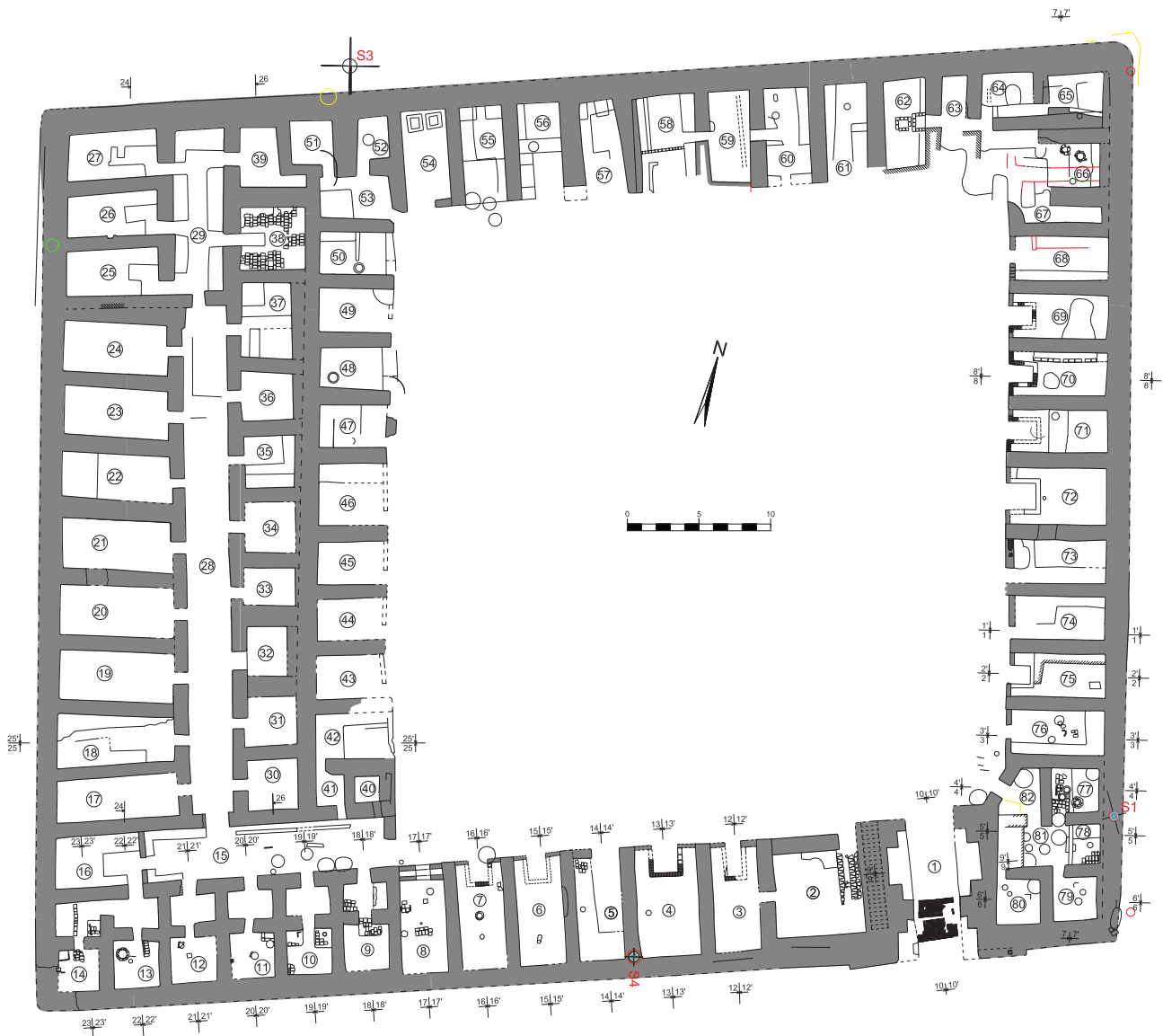
Рис. 2. Пайкенд. Рабат 4. Общая планировка помещений 2-го строительного этапа Fig. 2. Paikend. Rabat 4. General layout of the rooms of the 2 nd construction stage

лепипед. Он вытянут вдоль той же торговой трассы, идущей от южных ворот цитадели Пайкенда в сторону Бухары, что и Рабат -1, расположенный в 187 м. далее к востоку (рис. 2).