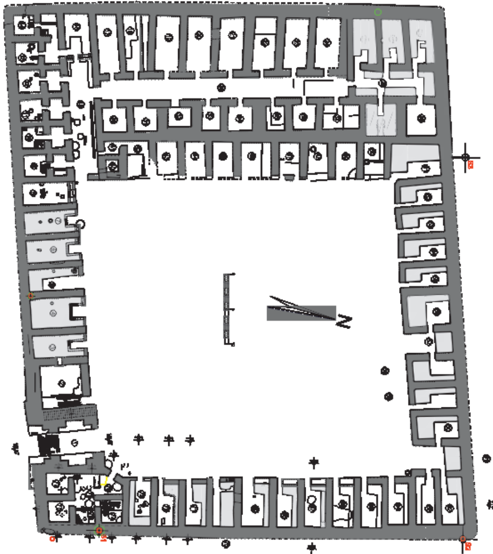
Рис. 3. Пайкенд. Рабат 4. Общая планировка помещений 1 строительного этапа с элементами перестроек 2 строительного этапа