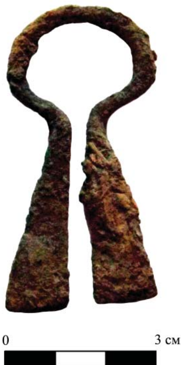
Рис. 2. Сюльгама, застежка для одежды с двумя вытянутыми лапками. Периферия городища Жайык. Fig. 2. Sylgama clothing fastener with two elongated pins. Periphery of Zhaiyk settlement.