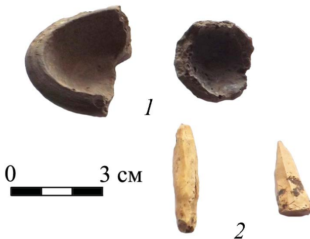
Рис. 3. Фрагменты миниатюрных сосудов и ограненные изделия из кости. Периферия городища Жайык. Fig. 3. Fragments of miniature vessels and faceted bone items. Periphery of Zhaiyk settlement.