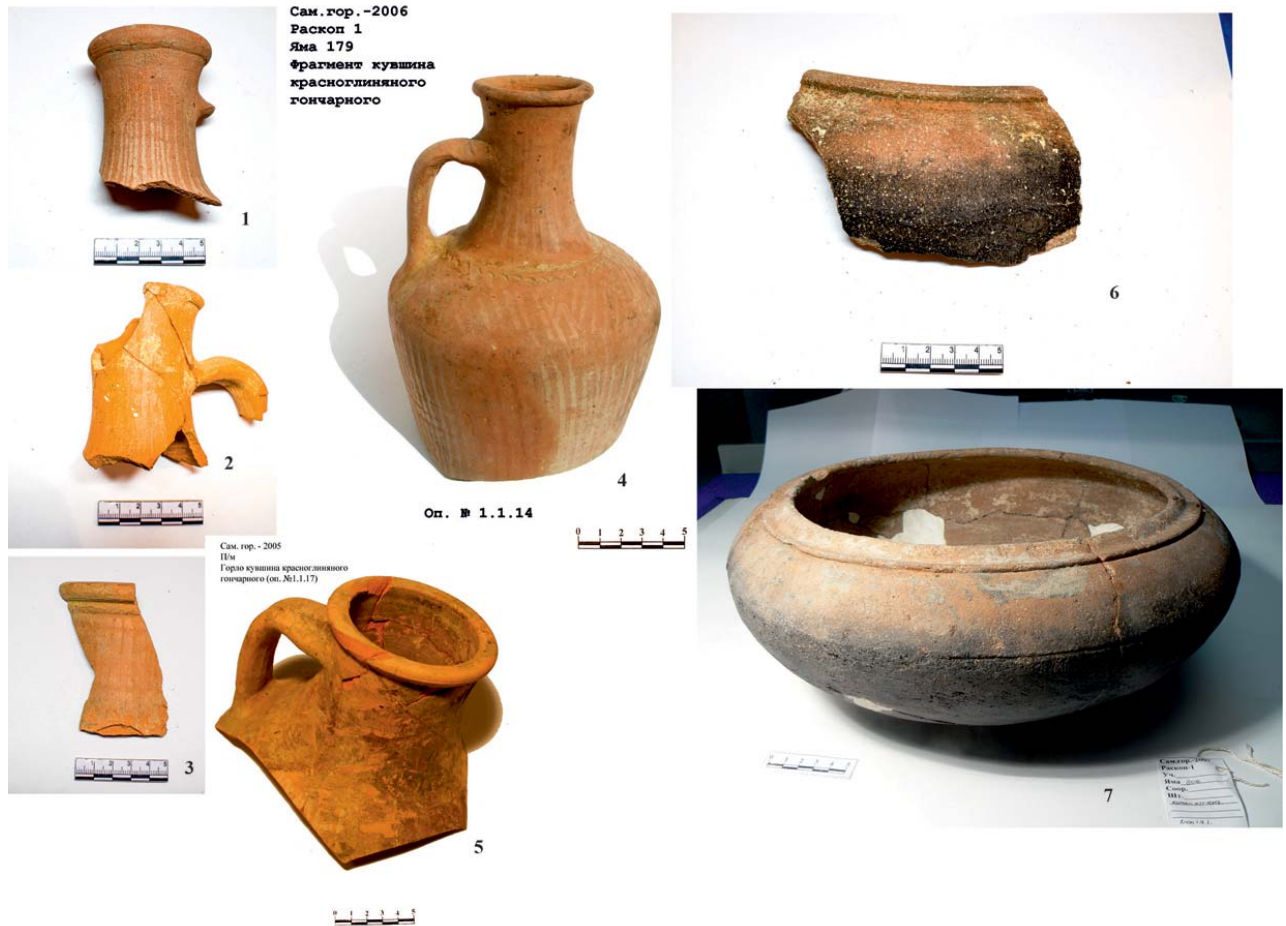
Рис. 2. 1–3, 6 – Кызылкала; 4, 5, 7 – Самосдельское городище. Fig. 2. 1–3, 6 – Kyzyl Kala; 4, 5, 7 – Samosdelska settlement.