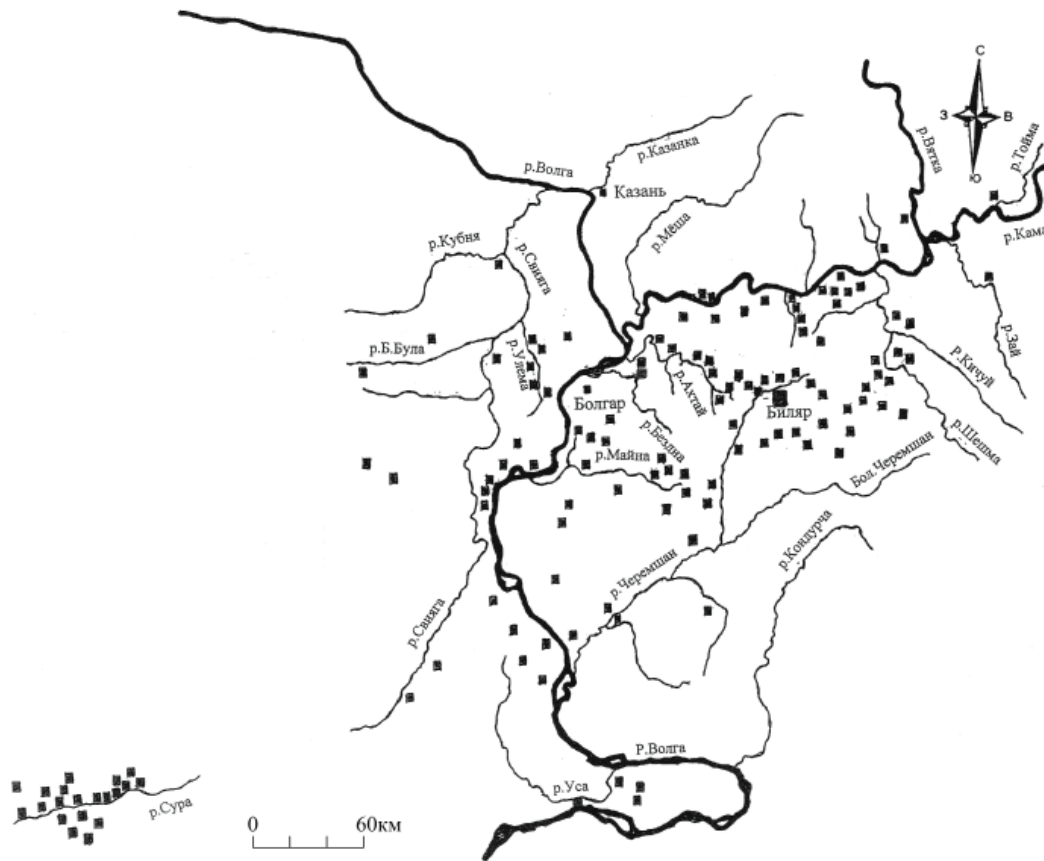
Рис. 1. Карта распространения городищ Волжской Булгарии в домонгольское время.