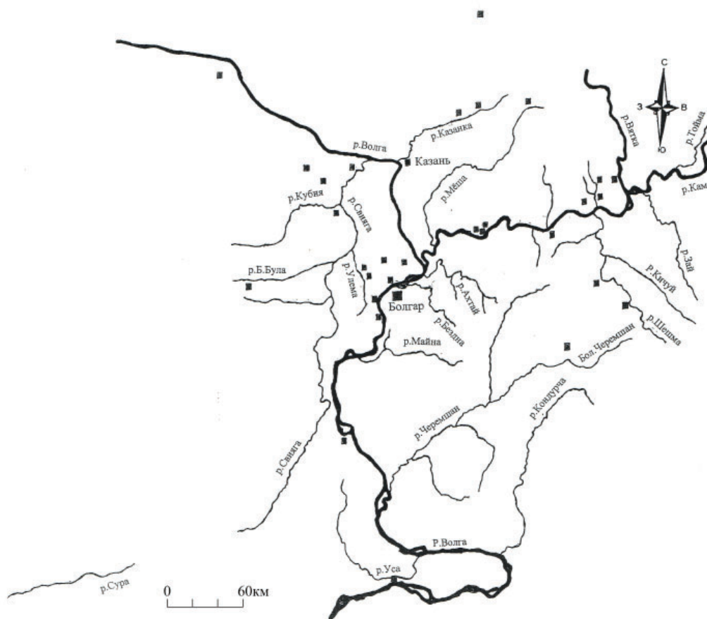
Рис. 2. Карта распространения болгарских городищ в золотоордынский период.