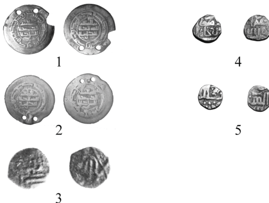
Фототаблица 2. №№1-2 – монетовидные подвески; №3 – пул 807 г.х. (1404-1405); №4 – обрезанный дирхам Узбека, вес 0,50 г; №5 – обрезанный дирхам Джанибека, вес 0,35 г. Photo table 2. Nos. 1-2 – coin-shaped pendants; No. 3 – pul of 807 AH. (1404–1405); No. 4 – cut dirham of Uzbek, weight 0.50 g; No. 5 – cut dirham of Janibek, weight 0.35 g.