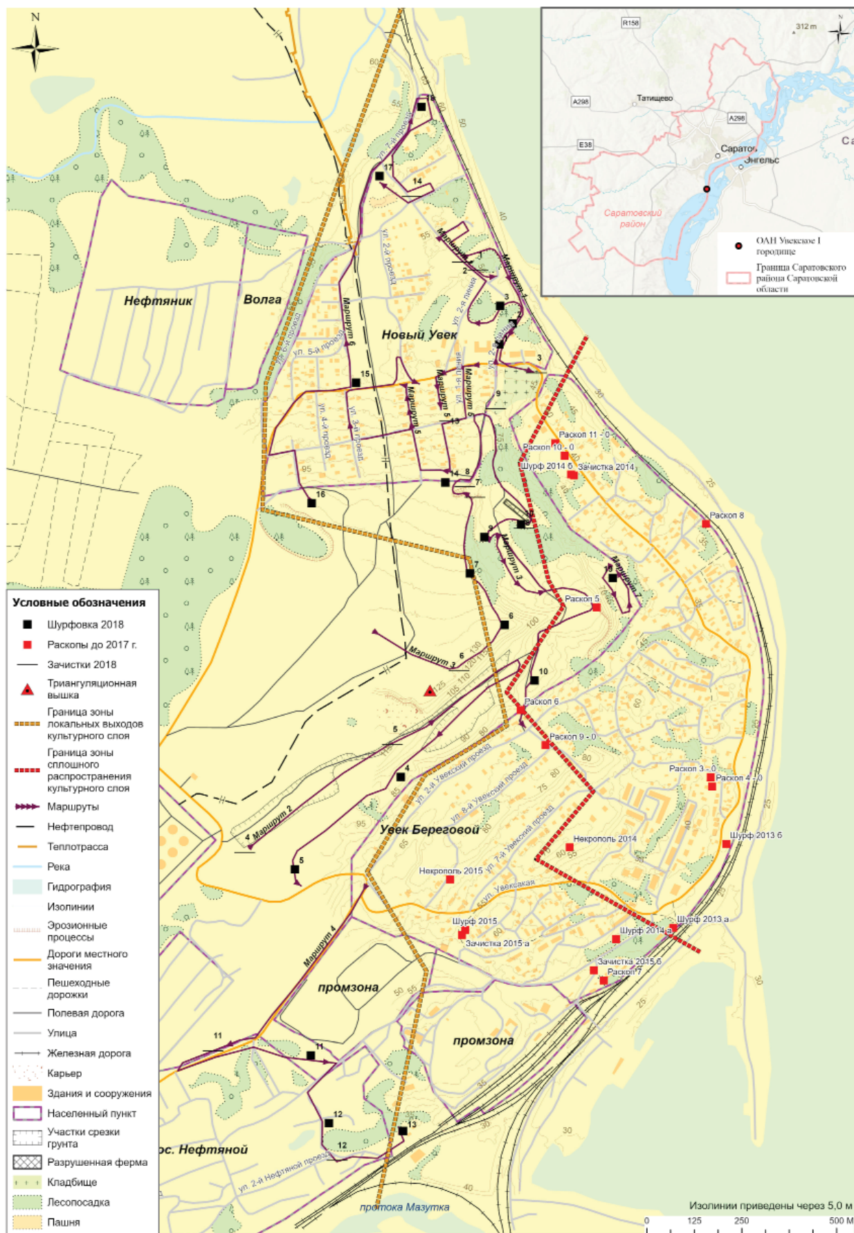
Рис. 1. Увекское городище, 2018 г. Топографический план с указанием маршрута разведок 2018 г. и расположения раскопов, шурфов, зачисток.