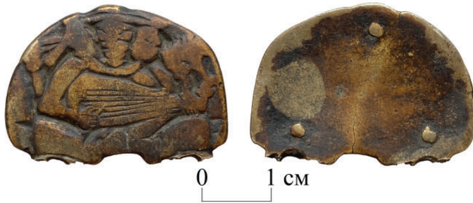
Рис. 1. Каменнодольская находка. Fig. 1. The Kamennodolsk finding.