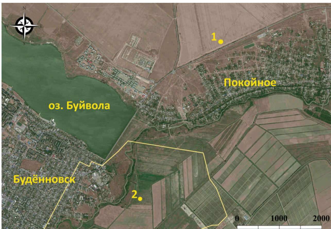
Рис. 5. Карта территории, примыкающей к Маджарскому городищу. 1 –Курганный могильник Покойное 2, Курган 8; 2 – Маджарское городище, раскоп XII. Fig. 5. Map of area, adjacent to the medieval city of Majar. 1 – Barrow cemetery Pokoynoye 2. Barrow 8; 2 – Medieval city of Majar, excavation XII.