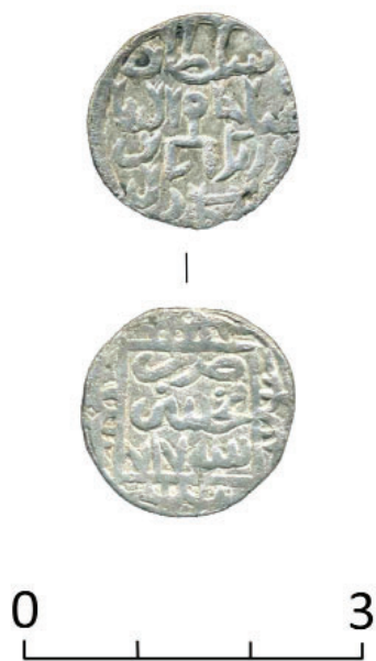
Рис. 6. Курган 8 могильника Покойное 2. Монета города Мохши.

В заключение отметим, что монета, происходящая из кургана 8 могильника Покойное