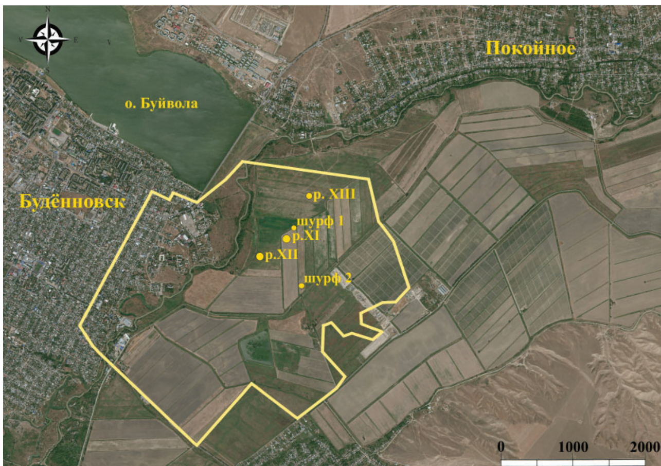
Рис. 2. План Маджарского городища с нанесением раскопов и шурфов, исследованных археологической экспедицией «Каффа».