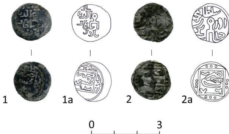
Рис. 4. Маджарское городище. Монеты города Мохши из археологических исследований на раскопе XII Fig. 4. Medieval city of Majar. Coins, minted in Mukhshi – the city of the Golden Horde, from excavation XII.