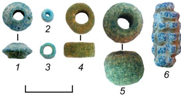
Рис. 1. Фаянсовые бусины некрополя у пос. Заозерное. 1, 2, 4 – склеп 1984 г.; 3 – курган 31а; 5 – курган 34; 6 – курган 40 Fig. 1. Faience beads from the necropolis near Zaozernoe village. 1, 2, 4 – 1984 crypt; 3 – barrow 31a; 5 – barrow 34; 6 – barrow 40

из могильника Опушки (Храпунов и др., 2009, с. 28). Е.М. Алексеевой было учтено всего 318 экз. подобных фаянсовых бусин, что значительно меньше найденных в некрополе. Они были обнаружены в комплексах, датировки которых позволяют отнести их к I–II вв.