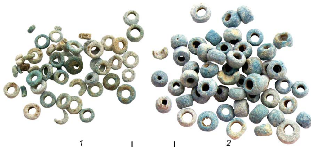
Рис. 2. Фаянсовые бусины из склепа 1984 г. в некрополе у пос. Заозерное Fig. 2. Faience beads from the 1984 crypt in the necropolis near Zaozernoe village

IV–II вв. до н. э. малочисленна, выделяется нечетко и содержит типы, близкие поздней группе, пик в распространении которых относится к I в. н. э., а наплыв их начинается уже со второй половины I в. до н. э. (Алексеева, 1975, с. 28).