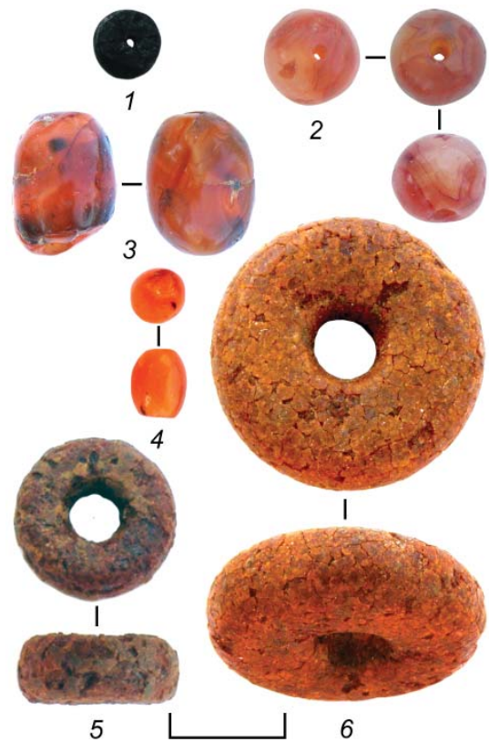
Рис. 5. Бусины некрополя у пос. Заозерное.

Среди рассматриваемых бусин присутствует всего 10 гагатовых (склеп 1983 г.). Все они округлой цилиндрической формы (рис. 5: 1). Согласно данным Е.М. Алексеевой, этот тип – короткоцилиндрические нарезки – является самым многочисленным в Северном Причерноморье. В Своде из всех учтенных 7416 гагатовых украшений 5026 экз. составляют бусы аналогичные нашим (Алексеева, 1978, с. 14, 85, табл. 20: 41, тип 27а). Этот тип бусин был популярен во все времена – с III в. до н. э. вплоть до IV в. н. э., однако основное количество комплексов с такими бусами датированы I–II вв. н. э., а к эллинистическому времени относится немного погребений. При этом основная масса бусин раннего времени сосредоточена на востоке Причерноморья: в Пантикапее, Фанагории, Кехах, Тирамбе, Горгииппии, Танаисе. Кроме того, бусины