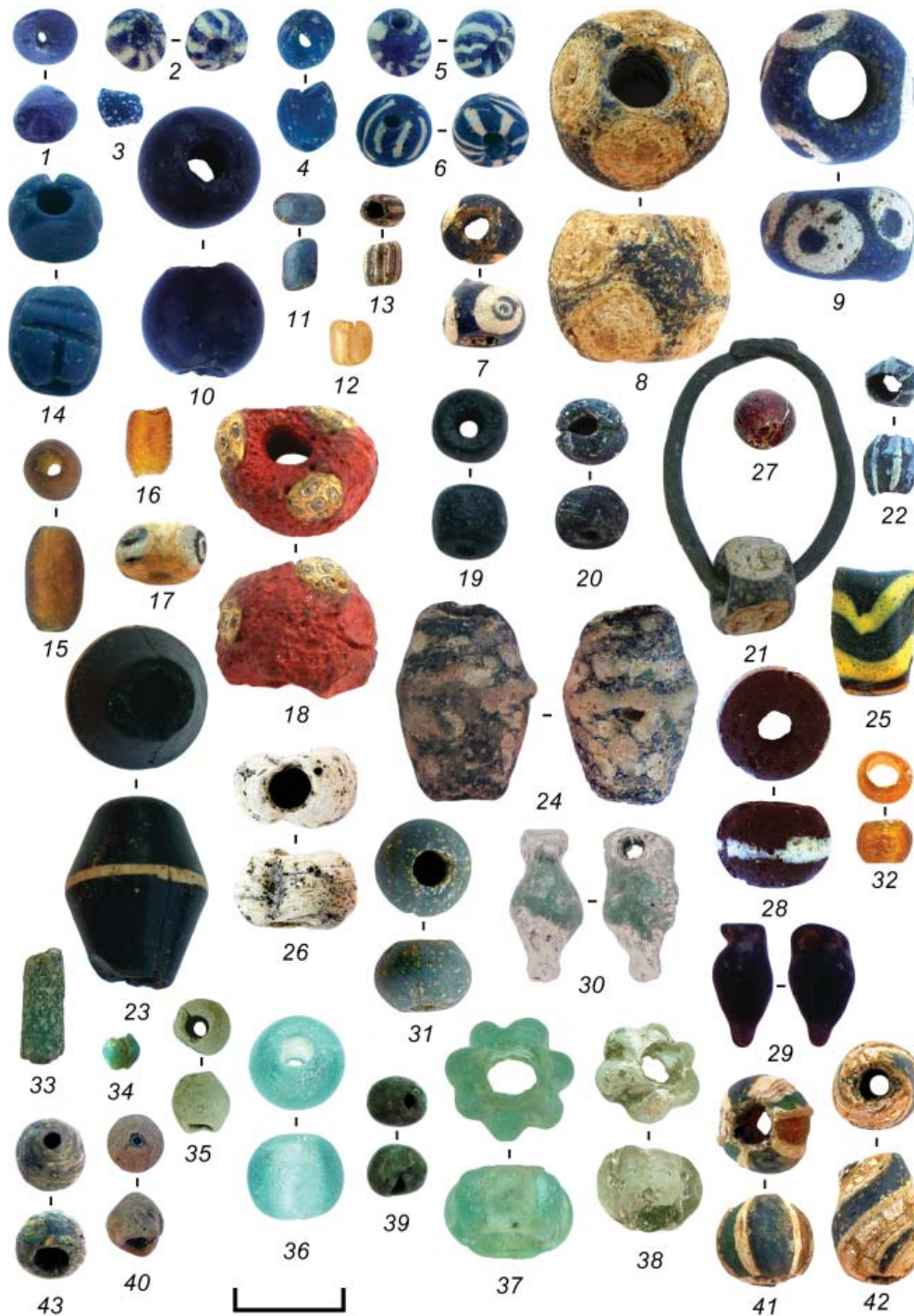
Рис. 4. Стекланные бусины некрополя у пос. Заозерное. 1, 9, 34 – склеп 1979 г.; 2, 30, 33, 40 – курган 41; 3, 24, 35, 39, 43 – курган 40; 4–6, 21, 23, 29 – курган 30; 7, 11–13, 18, 31, 32, 41, 42 – склеп 1984 г.; 8, 16, 17, 20, 26, 27, 36 – склеп 1985 г.; 10, 22, 28 – курган 31а; 14, 15, 19, 38 – склеп 1983 г.; 25 – курган 31; 37 – погребение ребенка 1984 г.