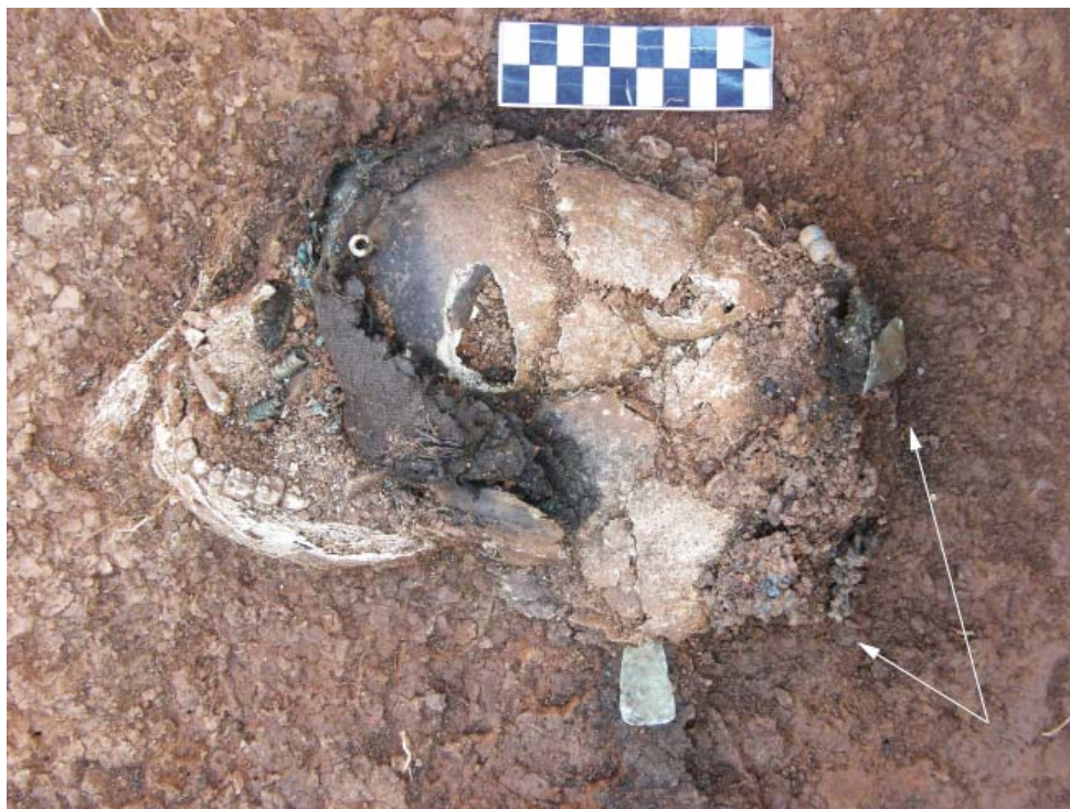
Рис. 3 Фиксация накосного кольчужного украшения in situ в погребении 99 Дубровского могильника.