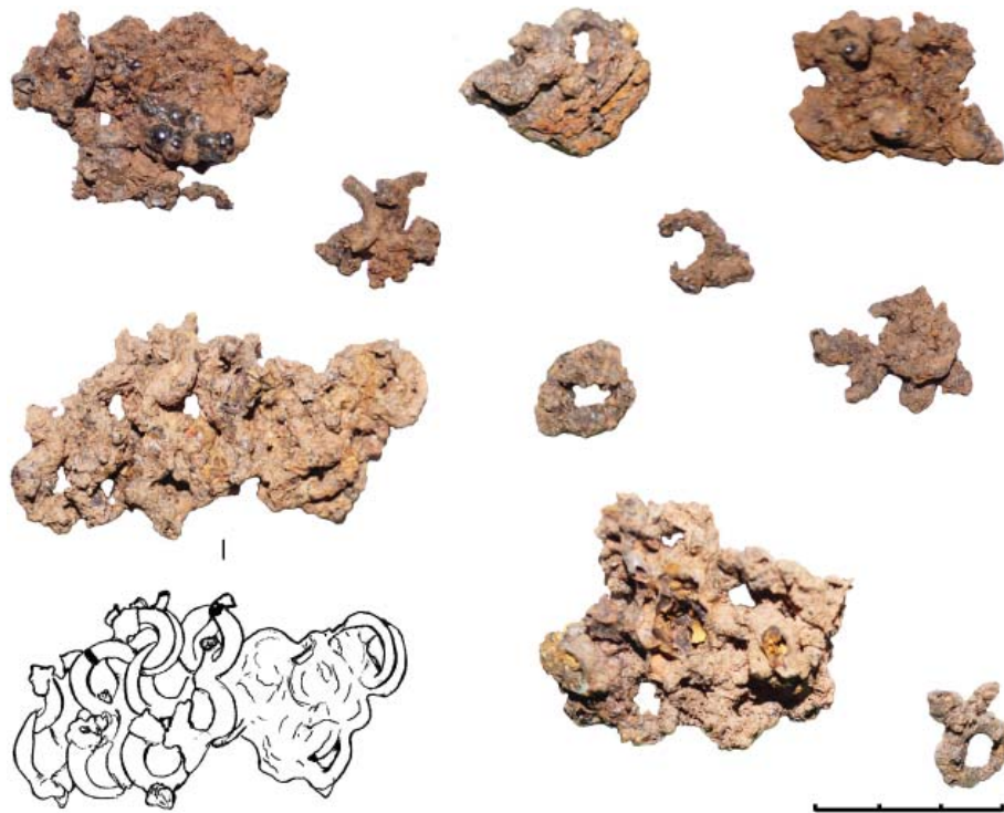
Рис. 2. Фрагменты накосного украшения кольчужного плетения из погребения 99 Дубровского могильника (железо).