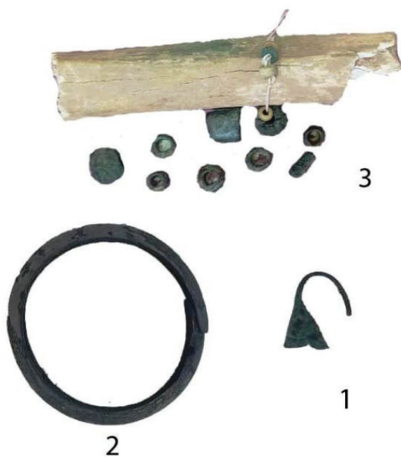
Рис. 2. Ювелирные украшения: 1 – серьга; 2 – браслет; 3 – бусы.